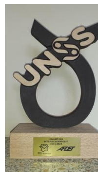
Le trophée UNSS-AFDET

Merci à l'UNSS pour sa très bonne collaboration avec l'AFDET