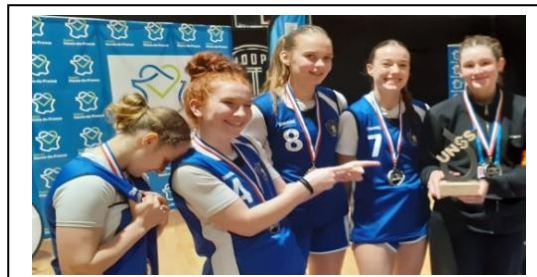
La fierté de posséder le beau trophée de l'UNSS