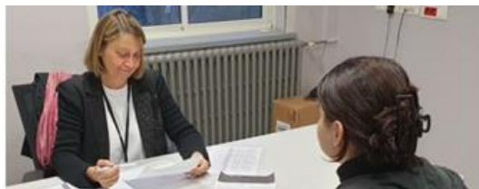
Séquence d'une simulation d'entretien d'embauche (animateur et élève)

Les animateurs AFDET sont intervenus en mars et avril auprès des élèves de treize classes aux dates suivantes :