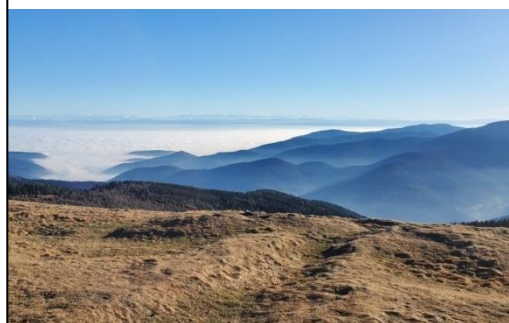
Randonnée d'altitude : découverte et dépassement de soi.