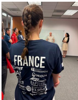
Réception des équipes françaises au consulat général de France à Houston par Mme la Consule générale.

L'AFDET s'affiche à Houston (USA) aux côtés de FERDIBOTEAM en apportant sa contribution financière à ce projet exceptionnel