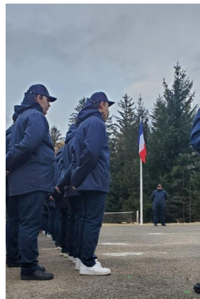
Levée des couleurs lors du stage à Sondernach –janvier 2025.

Ce projet illustre pleinement les valeurs portées par l'AFDET : former des jeunes compétents, responsables et engagés, conscients des enjeux sociaux et environnementaux d'aujourd'hui et de demain.