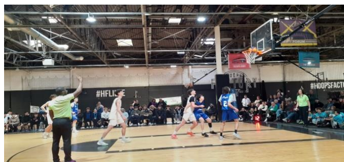
L'une des équipes en action