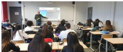
Pré-visite en classe entière pour préparer une SEE individuelle